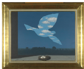
© Charly Herscovici, avec son aimable autorisation c/o SABAM-ADAGP, 2009

9月8日、マグリット美術館は、マグリット財団会長、ベルギー王立美術館館長などが出席の下、100万人目の入館者を迎えた。同美術館は、2009年開館6か月目にすでに37万5千人の入館者を記録しており、目標年平均50万人の入場者数を十分に達成した。入場者の半数は、フランス、オランダ、ルクセンブルグ、イタリア、ドイツなどのヨーロッパをはじめ外国からの訪問者という。